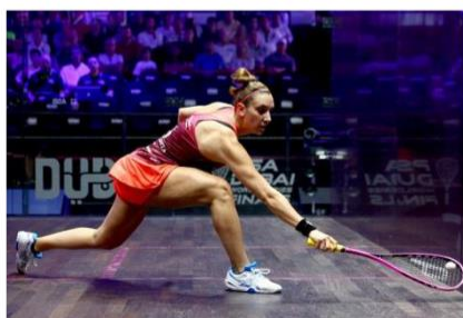
Camille Serme :

Ex N° 1 française 11 fois championne de France 8 titres internationaux, Retraite internationale en 2011 Meilleur classement mondial 10 ème