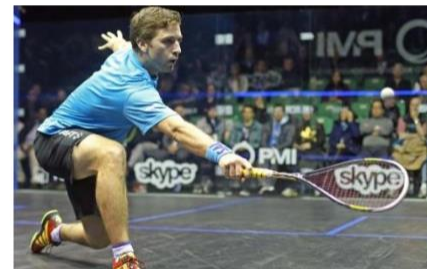
Mathieu Castagnet :

10 titres de champions d'Europe 7 fois champion de France 40 titres internationaux N°1 mondial 2009, 2015 et 2017 Champion du monde 2015