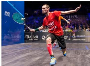
Grégory Gaultier :

10 fois champion de France 22 titres internationaux Champion du monde 2004 N° 1 mondial 2004/2005 Retraite internationale 2013